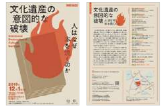
シンポジウム (2019年12月1日開催) Symposium 2019 (held December 1, 2019)