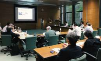
第33回西アジア分科会の様子 (2019年7月5日開催) The 33rd Subcommittee for West Asia (held July 5, 2019)