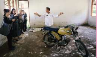
インドネシア・スラウェシ島地震被災地での調査 Survey in areas affected by the earthquake disaster on the island of Sulawesi, Indonesia

Japan that would be more effective in that event. The survey findings to date are presented in an electronic edition of the report available for viewing on our website. Ever since its founding, the Consortium has conducted surveys in numerous countries. In recent years, discussions have been proceeding on new survey themes in response to the changes of the times.