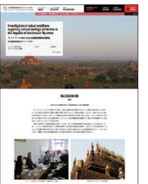
ウェブサイト上で公開されている会員実施事業の概要 (マップ画面・個別ページ画面)