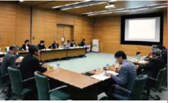
第62回企画分科会の様子 (2019年4月10日開催) The 62nd Subcommittee for Planning (held April 10, 2019)

* Information on subcommittee meetings is provided in email newsletters sent to Consortium members. While meetings are open to all members in principle, some may be closed depending on the subjects discussed.